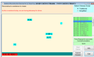
圖三：句子重組練習