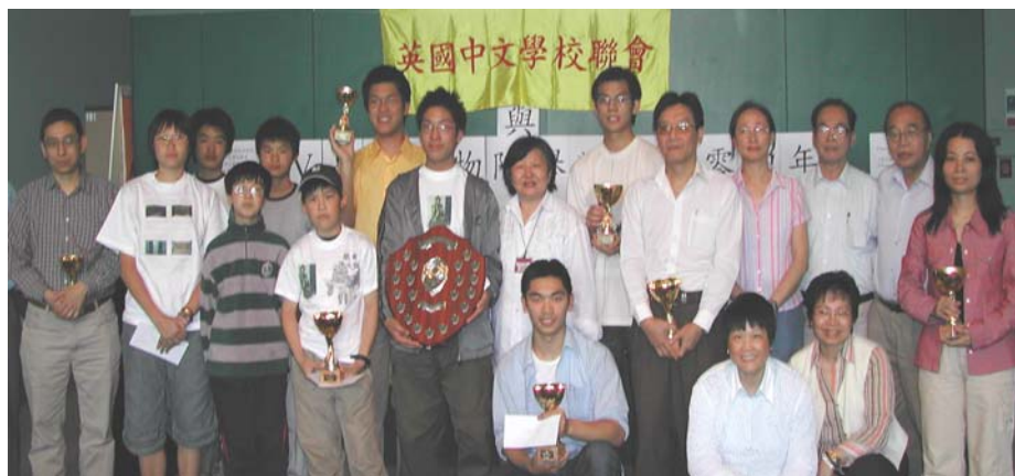
中國象棋比賽參賽選手合影

所有參賽學生每人各獲購物券一張。此次比賽之成功，有賴多方面人士之協助及各學校之鼓勵和參與，聯會謹此致謝。