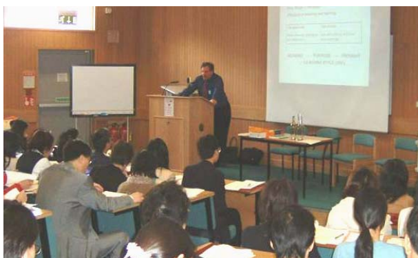
老師們正在聆聽主題講座