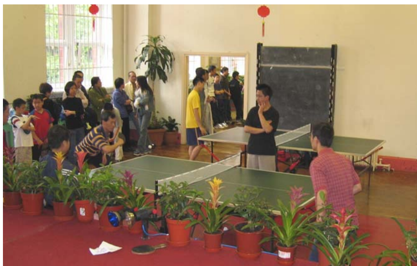
乒乓球選手緊張沉著地應戰