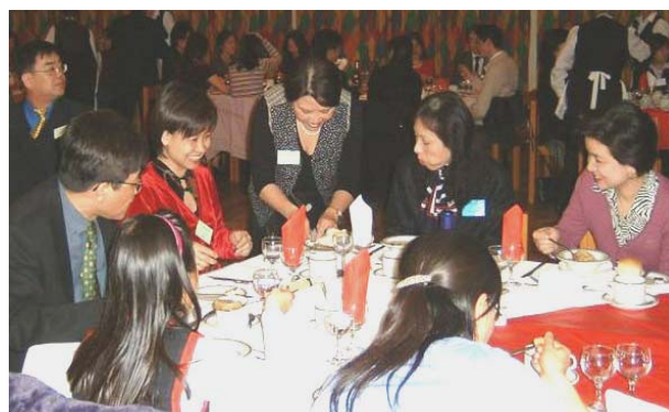
晚餐會上大家爭購獎券